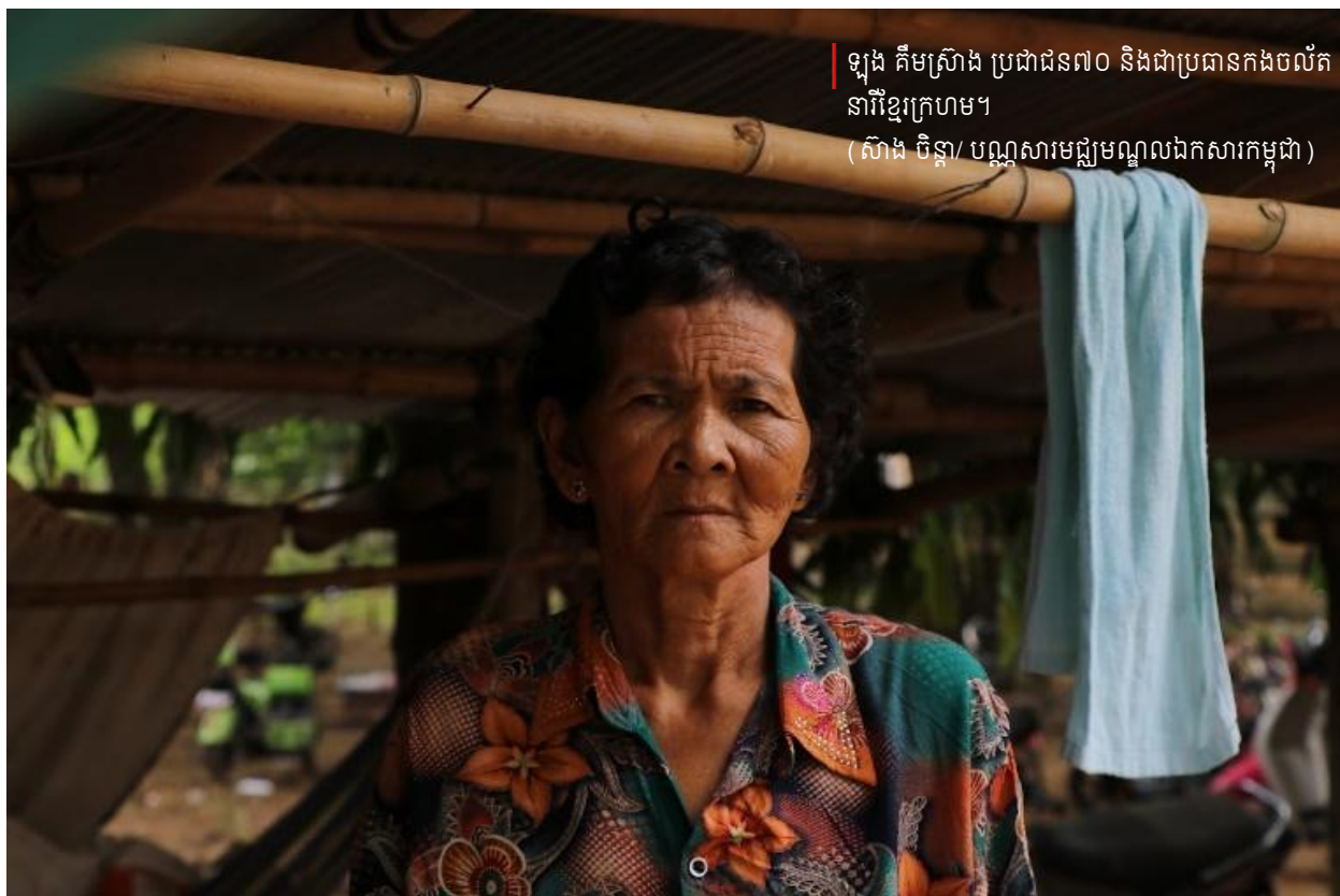
ឡុង គឹមស្រីង ប្រជាជន៧០ និងជាប្រធានកងចល័តនារីខ្មែរក្រហម។