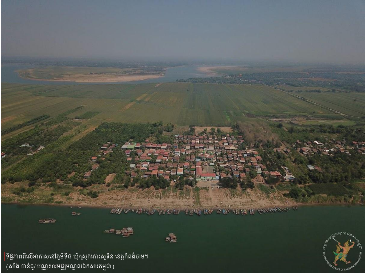
ទិដ្ឋភាពពីលើអាកាសនៅភូមិទី៨ ឃុំ/ស្រុកកោះសុទិន ខេត្តកំពង់ចាម។

ស្រាវជ្រាវ និងសរសេរដោយ៖ លី ជេវីត, សាំង ចាន់ធុ, និងទូច វណ្ណត ពិនិត្យដោយ៖ សាំង ចិន្តា ចាប់ពីខែតុលា ដល់ខែធ្នូ ឆ្នាំ២០២៤