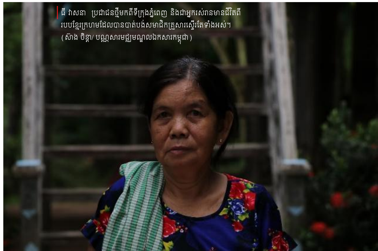
គឺ វាសនា ប្រជាជនថ្មីមកពីទីក្រុងភ្នំពេញ និងជាអ្នករស់រានមានជីវិតពី របបខ្មែរក្រហមដែលបានបាត់បង់សមាជិកគ្រួសារស្ទើរតែទាំងអស់។

ខ្ញុំរស់នៅភូមិទី៨ ឃុំកោះសូទិន ស្រុកកោះសូទិន ខេត្តកំពង់ចាម ជាមួយកូន។ ប្តីរបស់ខ្ញុំឈ្មោះ ម៉េ